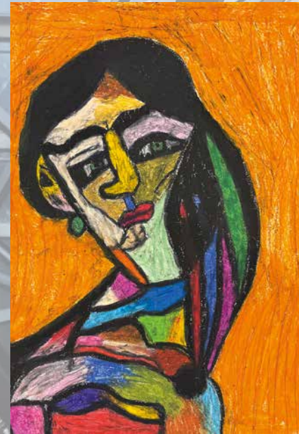
Verliebt ins Bild, Michelle Fleck