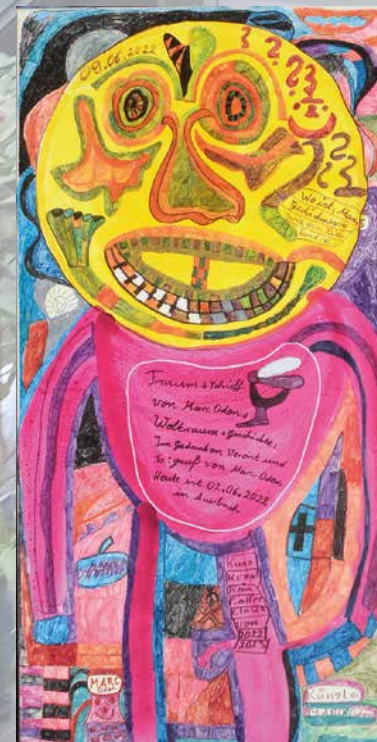
Das Traumschiff Enterprise, Marc Oden